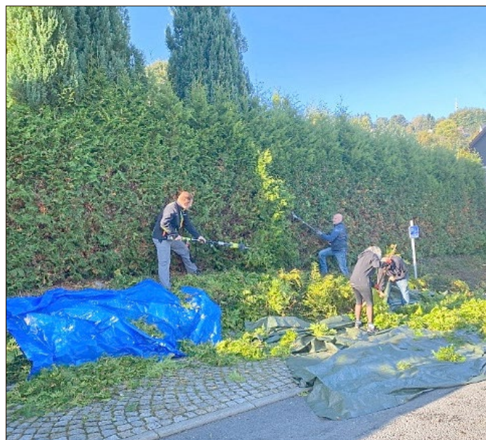
Bilder „Schnelle Kelle“

Das Jahr geht zu Ende, der Herbst naht, Zeit für die notwendigen Arbeiten auf dem Deesbacher Friedhof.